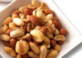
ミックснаッツ 350円 [税込] 385円