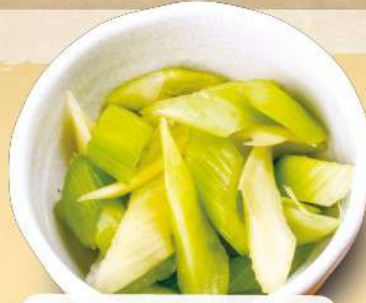
セロリ漬け 380円 [税込] 418円