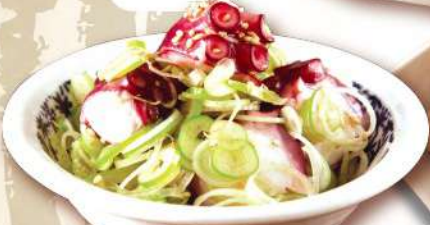
旨塩ねぎまみれ 550円 [税込] 605円