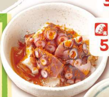
たこのガリシア風 550円 [税込] 605円