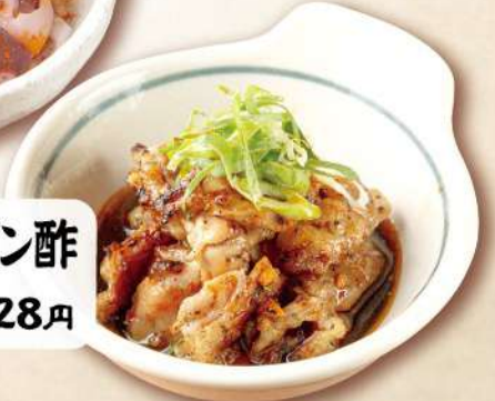
鶏ハラミポン酢 480円 [税込] 528円