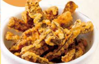
スタミナのリ天 350円 [税込] 385円