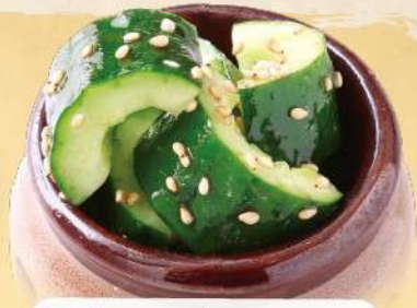
つぼきゅう 350円 [税込] 385円