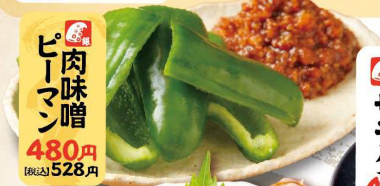
ピーマン肉味噌 480円 [税込] 528円