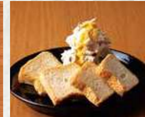
ラムエッセンス香るはちみつかけ クリームチーズ〜ラスクを添えて〜 レーズハニークリームチーズ 450円 495円(税込)