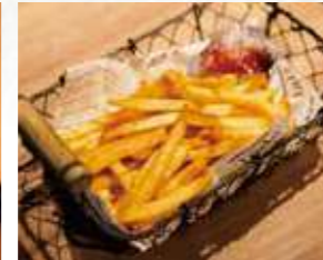
みんな大好き!定番の フライドポテト 490円 539円(税込)