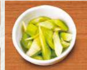
さっぱりシャキシャキ! セロリの浅漬け 400円 440円(税込)