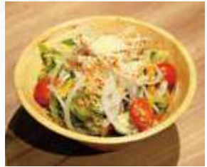
チーズたっぷりの シーザーサラダ 590円 649円(税込)