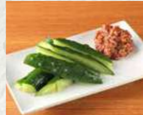
クセになる味! 肉味増きゅうり 450円 495円(税込)