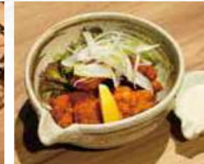
揚げたてジューシー! とりの唐揚げ 590円 649円(税込)