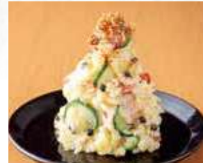
粒胡椒とアップルビネガーが決め手! 大人のポテトサラダ 480円 528円(税込)