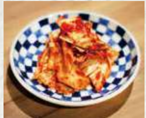
シャキッとパリッと! 生キムチ 400円 440円(税込)