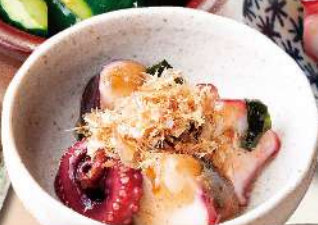
ダシの効いた! 梅たこ 550円 (税込605円)