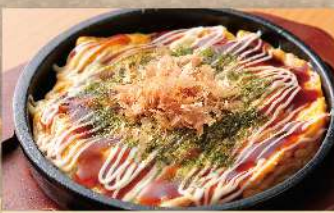
帰ってきた とんぺい焼 520円 (税込572円)