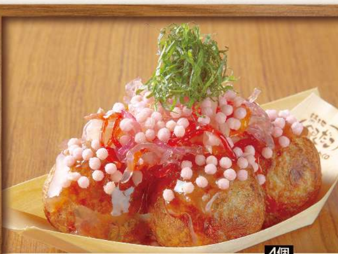
4個 岩下の新生姜たこ焼 490円 (税込539円)

ヨクと旨味が凝縮。フレッシュチーズとシャキシャキピリ辛わさびを合わせた限定たこ焼