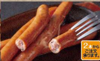
2本からご注文承ります。 タン入りブラックペッパーソーセージ 1本 220円 (税込242円)