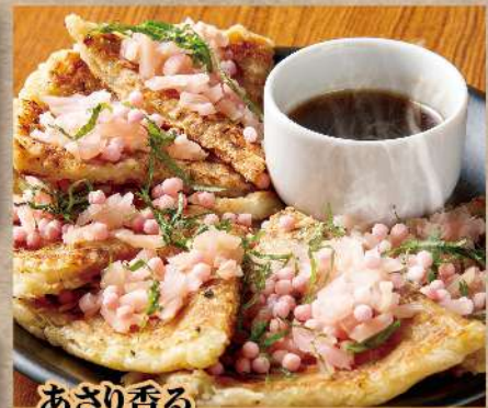
あさり香る 岩下の新生姜 ピンクのチヂミ 480円 (税込528円)