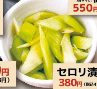
セロリ漬け 380円 (税込418円)