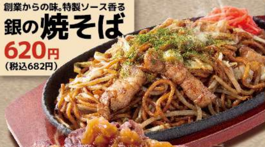
創業からの味。特製ソース香る 銀の焼そば 620円 (税込682円)

「岩下の新生姜」を使用。やさしい辛みと爽やかな香り、シャキシャキとした歯切れの良い、旨さつばり期間限定たこ焼