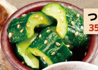
つぼきゅう 350円 (税込385円)