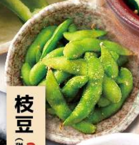
枝豆 税込385円 350円